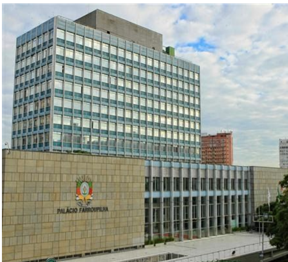
Figura - 01 - Palácio Farroupilha.