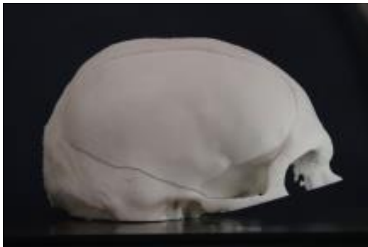
Figura 4 - Molde e prótese de cimento ósseo para reconstrução craniana

“A imagem tomográfica dá toda a dimensão do crânio. É calculada então a peça que está faltando e a impressora 3D faz o negativo ou molde correspondente. Por isso, se for necessário, dá para fazer um novo molde em um processo muito ágil, e pode ser esterilizado rapidamente. Isso “permite que o paciente saia do centro cirúrgico já com uma nova prótese”, explicou Rozental. (GRANDA, 2020)