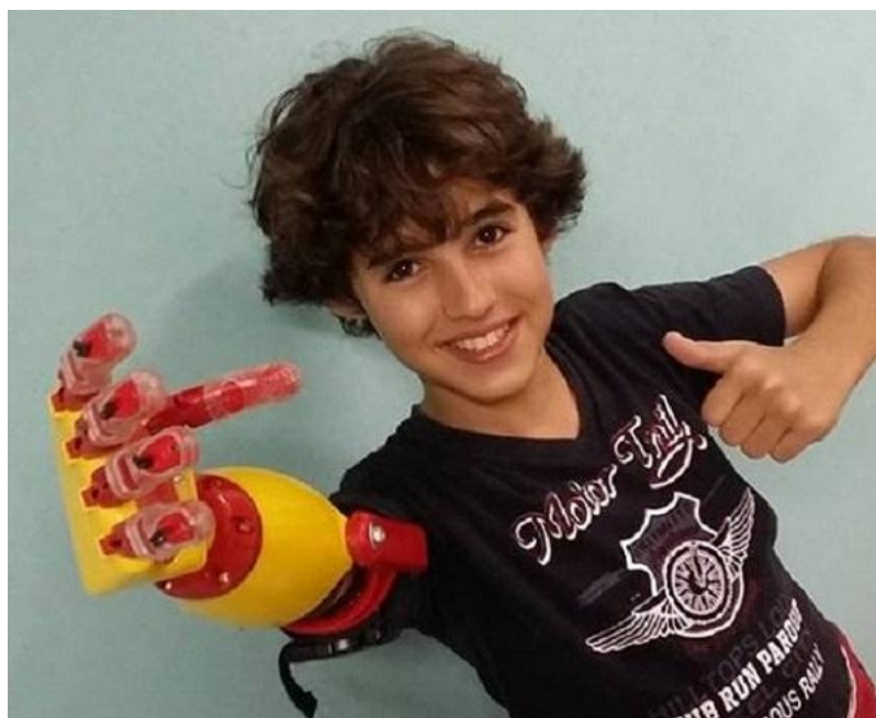
Figura 3 - Criança utilizando prótese feita em 3D