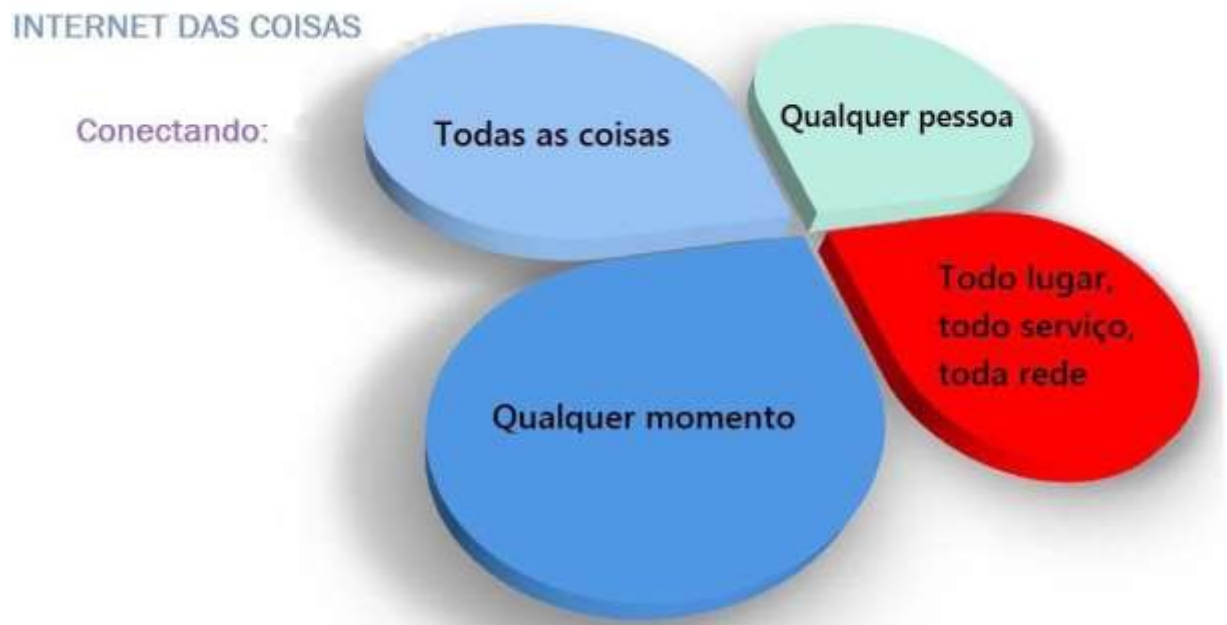
Figura 1 – Representação da “Internet das Coisas”